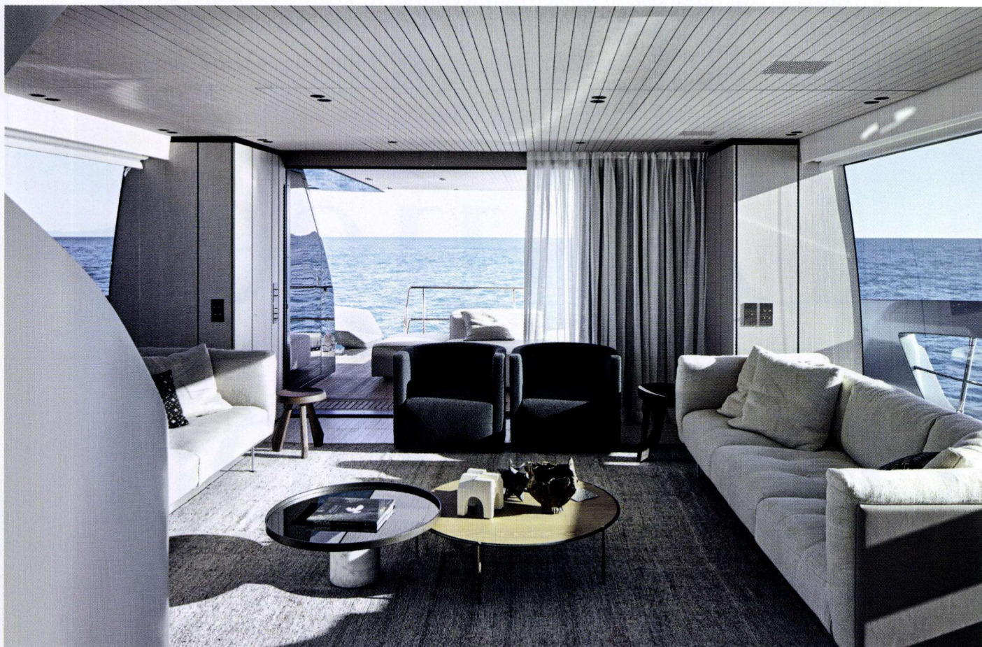
SOPRA Ancora il living. Il tappeto è di Beni Ourain Rugs. Nel pozzetto, in fondo, divano Extrasoft di Piero Lissoni (Living Divani). SOTTO, A SINISTRA La scala su disegno di Piero Lissoni. SOTTO, A DESTRA La dressing room della suite armatoriale.

immaginata a fine anni Sessanta per Flos, sembra allungare il becco per cogliere lo scatto di un pesce sott'acqua.